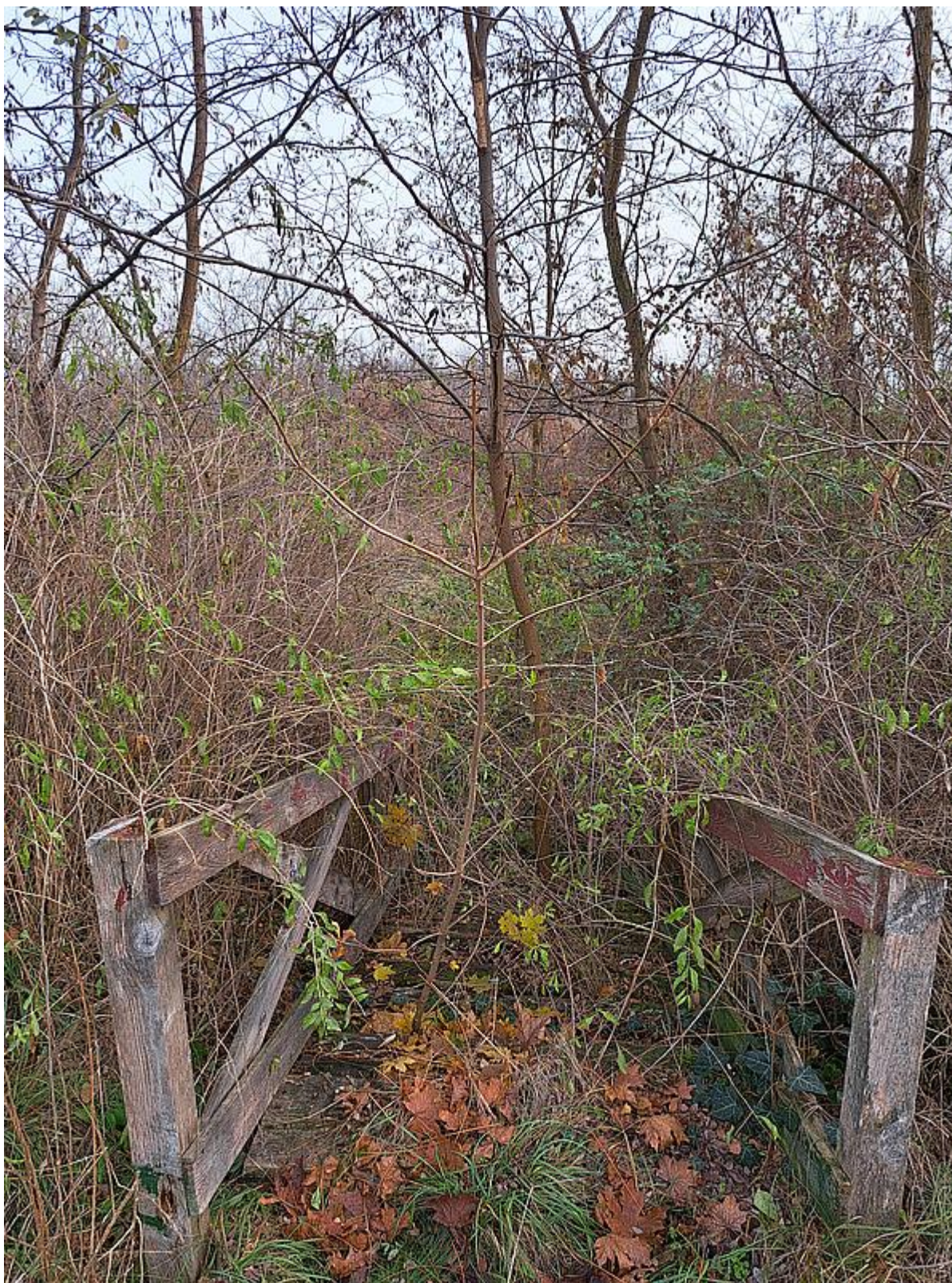
Idegenhonos fa- és cserjefajok dominálta terület (KE03)