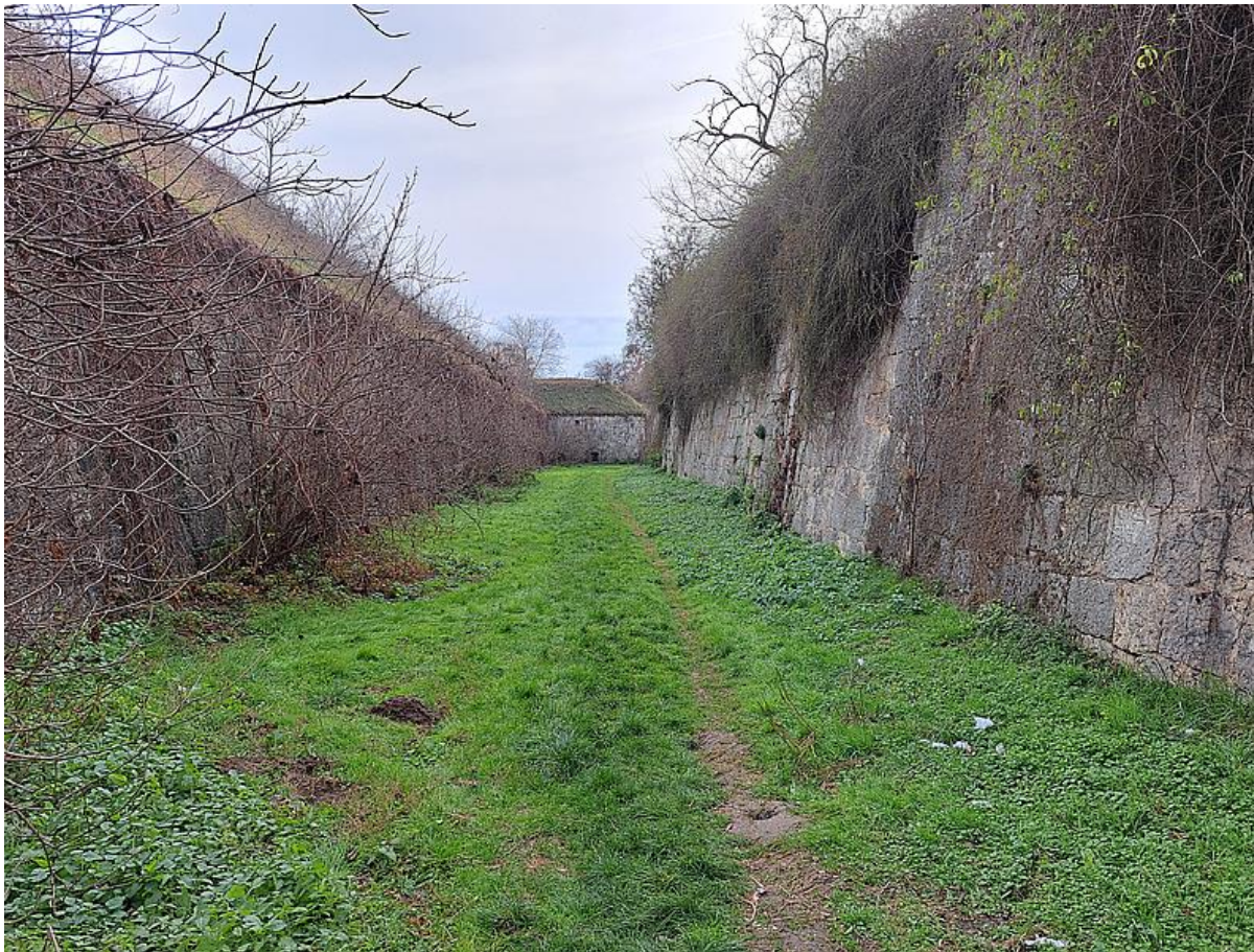
Üde gyep (KE02) az erőd árkában és idegenhonos fa- és cserjefajok az erőd falán