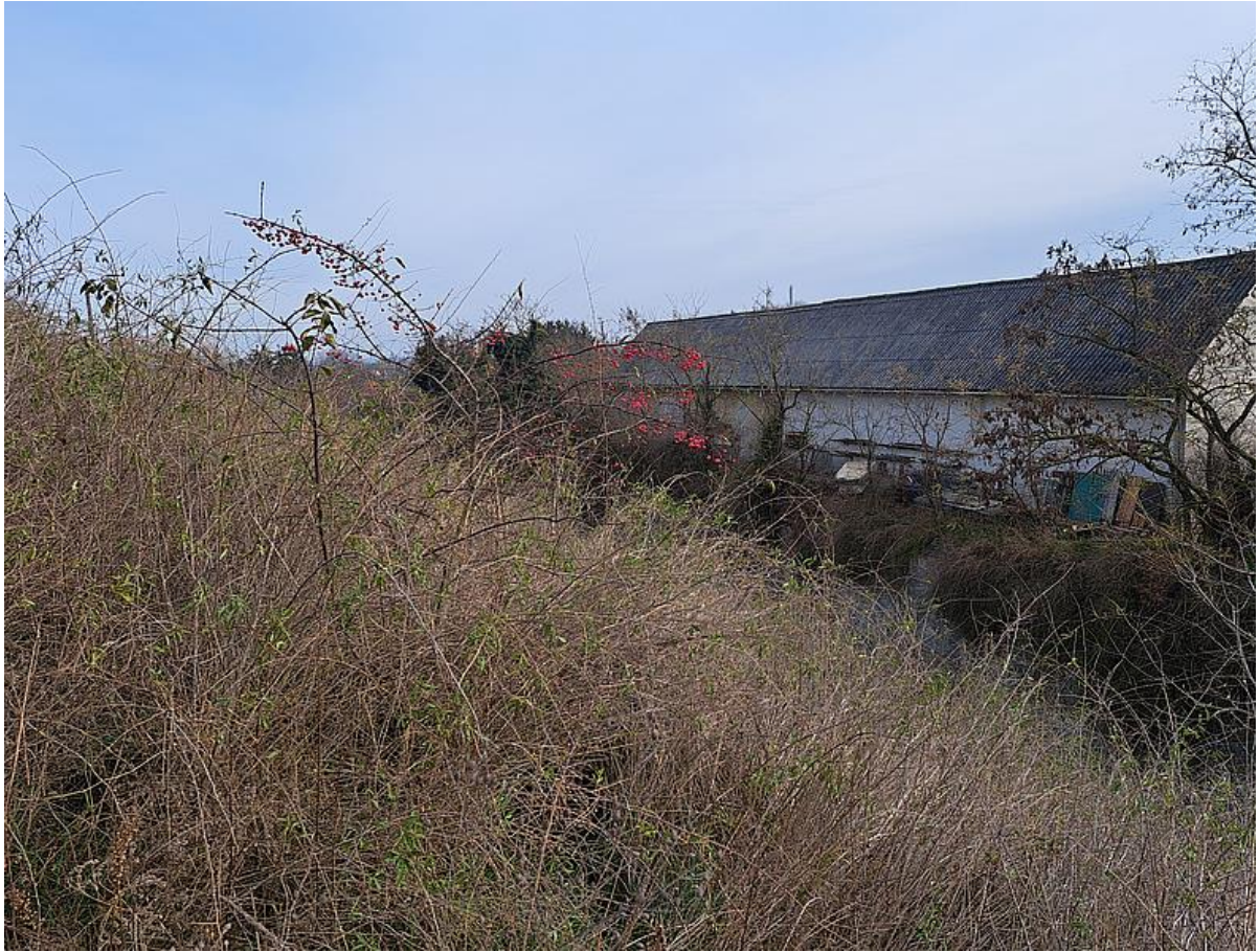
Ördögcérnával ( Lycium barbatum ) benőtt gyep (KE01) az erőd sáncának déli lejtőjén