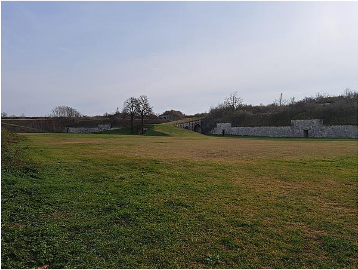
Rendszeresen nyírt másodlagos gyep (KE02) az Igmándi erőd belső részén