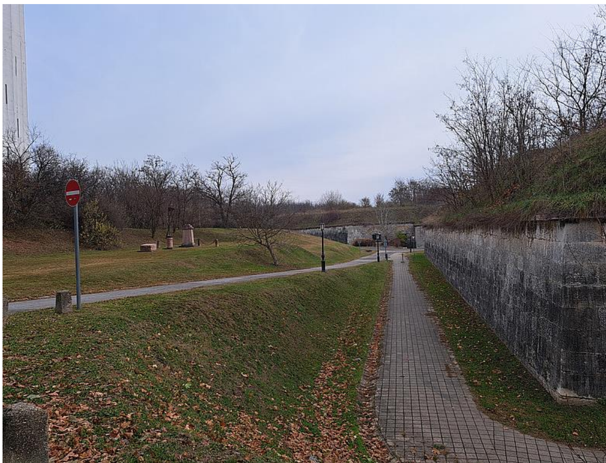
Park (KE02) az erőd falán kívül