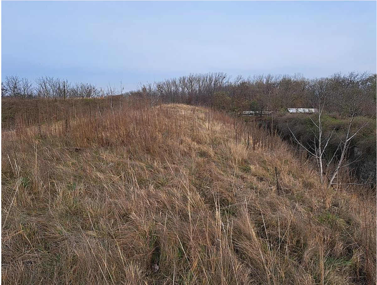
Természetközeli szárazgyep (KE01) az erőd sáncának déli lejtőjén